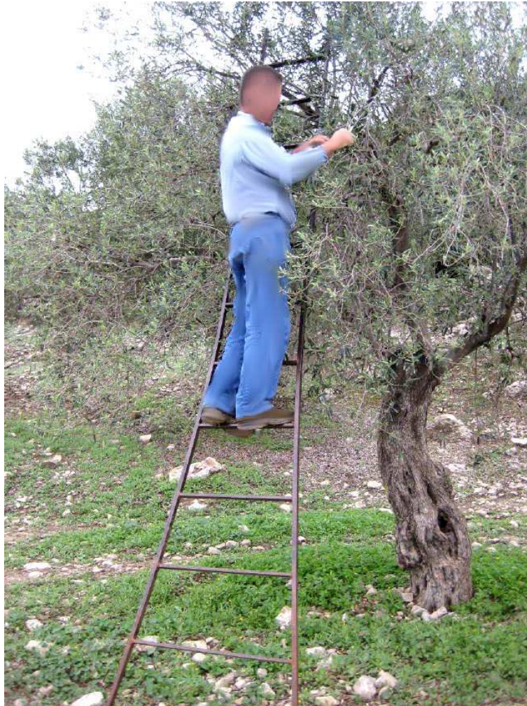
Imagen 1. Posición en la que estaba el trabajador recogiendo la aceituna de verdeo. Se observa también la escalera implicada en el accidente.

En un momento dado la rama, en la que estaba apoyada la escalera, se partió y la escalera giró sobre su base, desplazándose bruscamente sobre el tronco del olivo. Como resultado de ese movimiento repentino el trabajador perdió el equilibrio, introdujo su pierna derecha entre dos peldaños y al caer al suelo de espaldas desde 1 m de altura aproximadamente, junto con la escalera, se produjo la fractura abierta de la tibia de la pierna derecha.