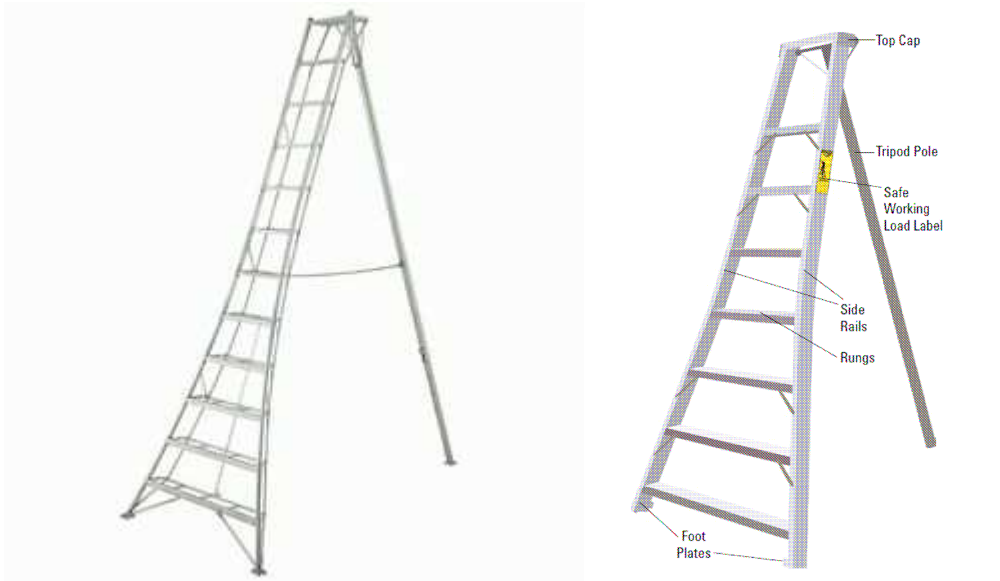
Imagen 3. Ejemplos de escaleras de recolección tipo trípode

estas se sustentan sobre si mismas. Las tres patas son mas estables en un suelo que no es uniforme y permiten trabajar en condiciones ergonómicas más aceptables.