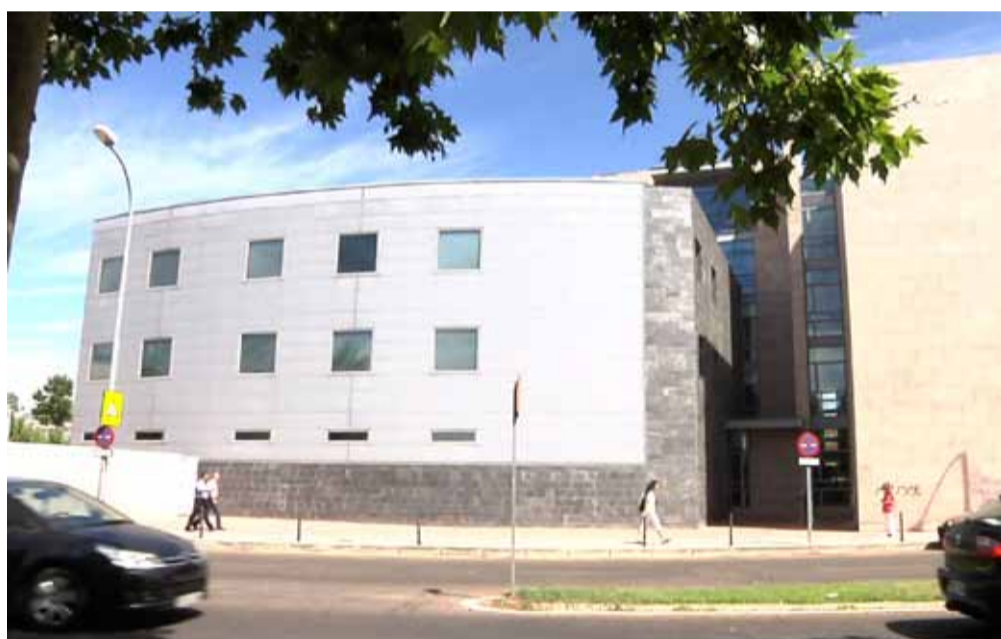
Sede de la Oficina Judicial de Cáceres

¿Cuándo será apreciable el cambio para el ciudadano?